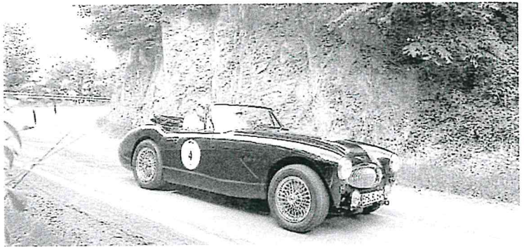
Oldtimer werden auch in Rheinland-Pfalz immer beliebter. Zu Beginn des Jahres waren 27 869 Fahrzeuge mit einem Alter von mindestens 30 Jahren registriert.

⇒ Mehr Infos unter www.mittelrhein-classic.de .