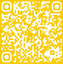
ADAC Mittelrhein e.V.

Für eine Teilnahme an Trial Veranstaltungen benötigen Jugendliche der Jahrgänge 2011 - 2019 einen gültigen ADAC Jugendausweis, welcher vom ADAC Pfalz e.V. oder ADAC Mittelrhein e.V. ausgestellt werden. Für die erstmalige Beantragung des Jugendausweises ist eine Befürwortung des Ortsclubs erforderlich.