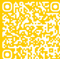
ADAC Pfalz e.V.